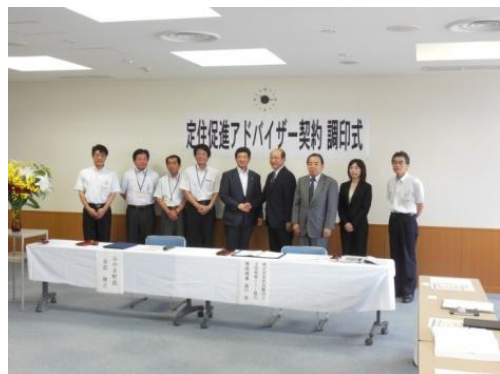
みやき町の皆さんと記念撮影をしました