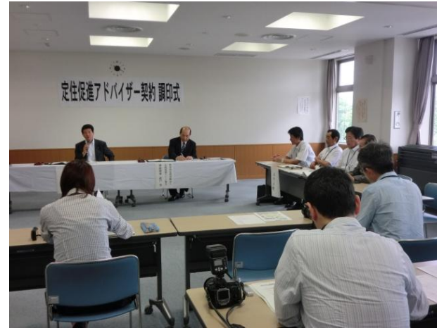
調印後の記者会見の様子です