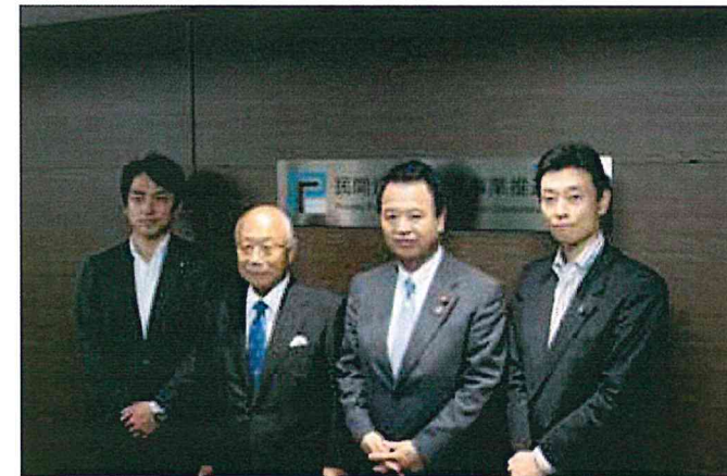
除幕式の様子(平成25年10月11日)